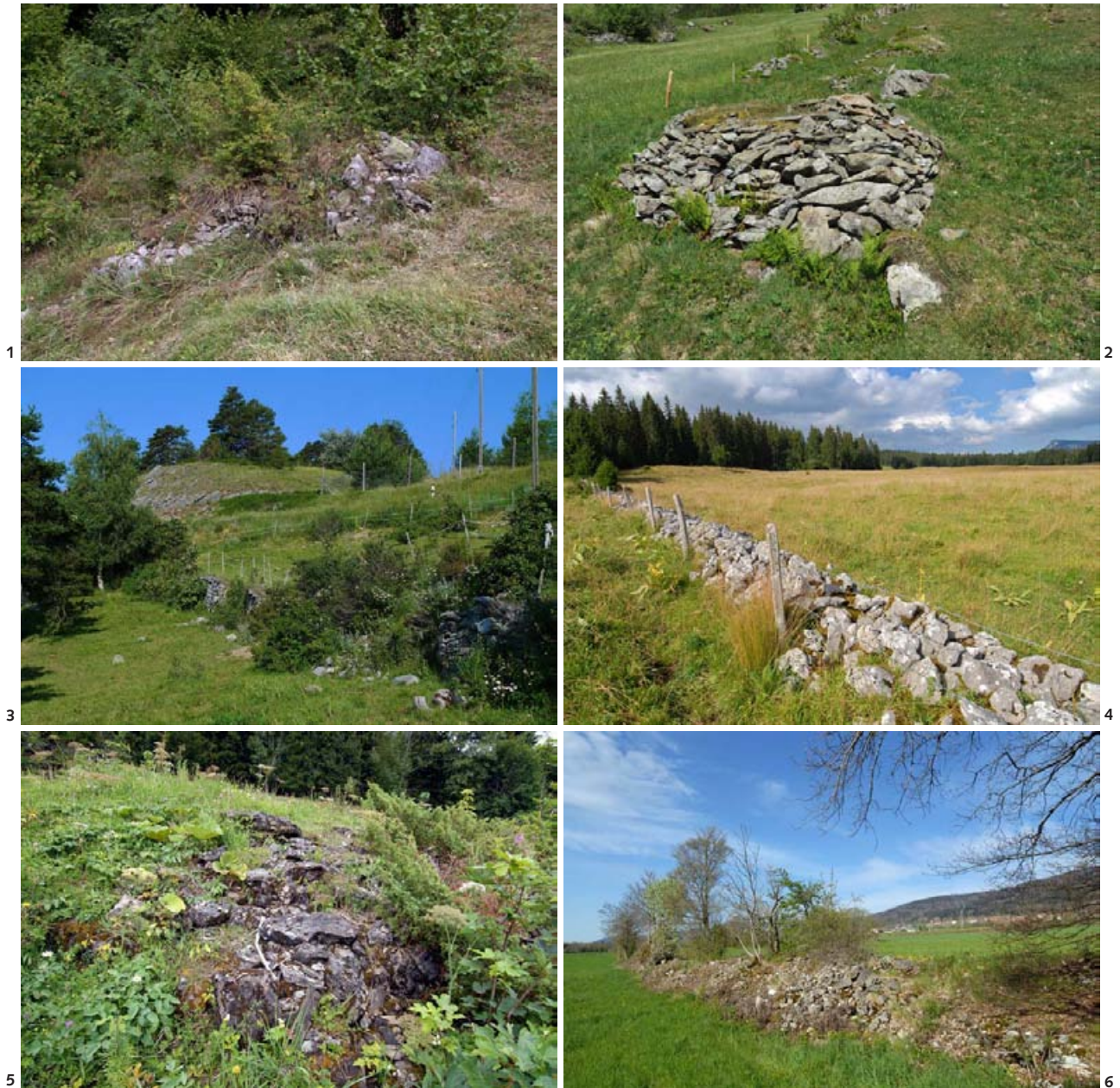
Abb. 1 Traditioneller Lesesteinhaufen am Rand einer Berner Oberländer Heuwiese, für Reptilien ideal strukturiert. Man beachte den teilweisen Bewuchs des Haufens, die unterschiedlich grossen Steine und die optimale Verzahnung mit der umgebenden Vegetation. (AM)

Abb. 2 Lesesteinhaufen auf einer Alpweide – perfekte Bedingungen für Reptilien und Co. (AM)